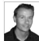
VAN ONZE REDACTEUR VINCENT