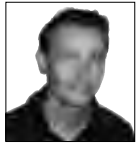
VAN ONZE REDACTEUR VINCENT S