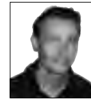
VAN ONZE REDACTEUR VINCENT S