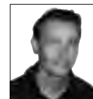
VAN ONZE REDACTEUR VINCENT S