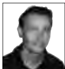
VAN ONZE REDACTEUR VINCENT S